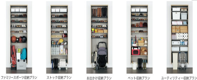
ファミリースポーツ収納プラン ストック収納プラン お出かけ収納プラン ペット収納プラン ユーティリティ収納プラン

玄関付近に置いておきたいけど、従来の玄関収納では収まりにくいベビーカーや大きなものまで、中の収納の形状を変えることで対応。またナノイー発生器で脱臭機能も備えたおすすめ玄関収納です。